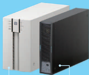
UPS1010HS (当社既存品) 250 × 150 × 395 (mm)